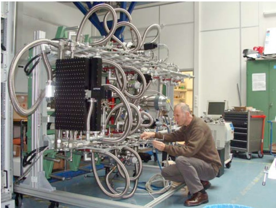
Le système de cryogénie en cours de test à l'ESO.