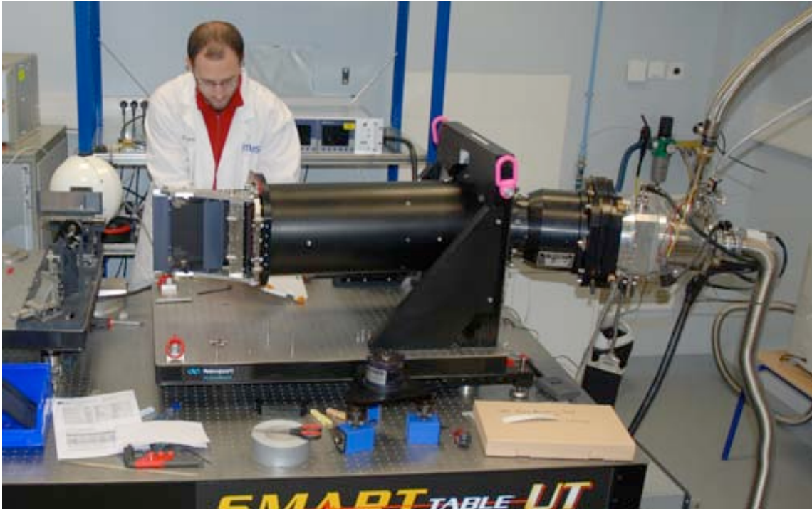
Un des 24 spectrographes Integral Field Unit.